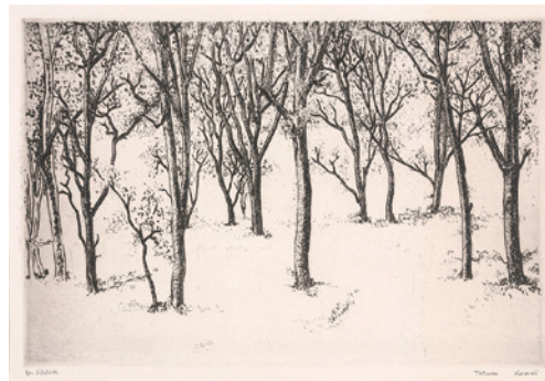
駒井哲郎《樹木》1957年、エッチング

会 期：2023年10月10日(火) - 2024年1月26日(金) [土日祝は休館] 開館時間：11:00~18:00 入 場：無料、事前予約不要 会 場：慶應義塾大学アート・センター (三田キャンパス南別館1階アート・スペース) 主 催：慶應義塾大学アート・センター お問い合わせ先：慶應義塾大学アート・センター 03-5427-1621 ac-tenji@adst.keio.ac.jp