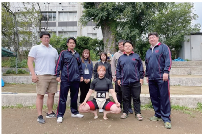
個人戦のほか、団体戦でも頑張っています

相撲部 公式Webサイト ▶https://www.uaa.keio.ac.jp/club/sumo/index.html