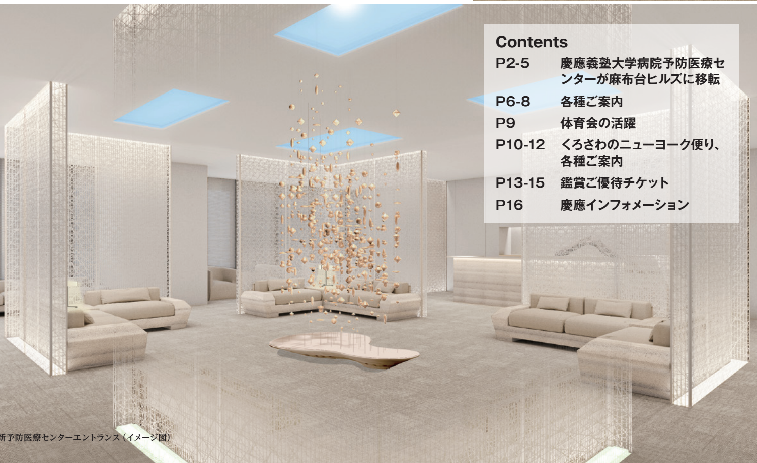
新予防医療センターエントランス (イメージ図)