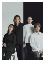
Direction: OGURA Toshimitsu

公演名・日時: 「尺には尺を」 10月20日(金) 13:00 「終わりよければすべてよし」 10月24日(火) 13:00 会場: 新国立劇場 中劇場 価格: S席 8,800円 ▶ 8,100円 出演: 岡本健一、浦井健治、中嶋朋子、ソニン ※4歳未満入場不可