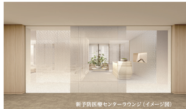
新予防医療センターラウンジ (イメージ図)