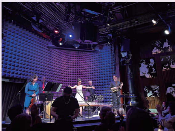
多くのお客様が来場された

彼の偉業とそのエネルギーは底知れず、自分がちっぽけにも感じるが、それも糧として次なる人生のステージに向かいたい。