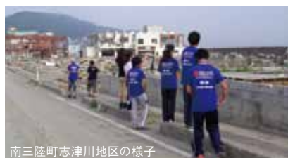
南三陸町志津川地区の様子

今回の慶應カードニュースでは、この夏実施された「慶應義塾・夏休み!南三陸支援プロジェクト」について簡単に紹介します。