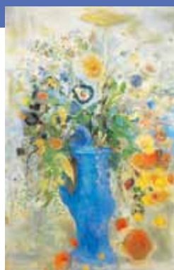
オディロン・ルドン 《グラン・ブーケ(大きな花束)》 1901年、画布・パステル 248.3cm×162.9cm 三菱一号館美術館蔵

英国人建築家ジョサイア・コンドル設計、明治27(1894)年のレンガ建築を可能な限り忠実に復元。2010年4月に開館し、19世紀近代美術を中心に現代にも通じるテーマの展覧会を年に3~4回開催しています。12月25日までは「トゥールーズ=ロートレック」展を開催。2011年1月17日からは岐阜県美術館所蔵「ルドンとその周辺ー夢見る世紀末」展~三菱一号館美術館《グラン・ブーケ(大きな花束)》収蔵記念~を開催。世界有数のルドン・コレクションを誇る岐阜県美術館の所藏品と、本展覧会の開催に合わせ、三菱一号館美術館が新規収蔵した《グラン・ブーケ(大きな花束)》を日本初公開します。