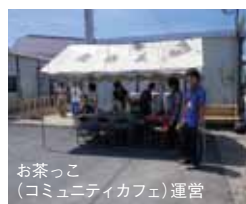
お茶っこ (コミュニティカフェ) 運営

参加メンバーは夏休み以後も活動を行っています。10月4日、10月10日にはボランティアバス参加者向けの事後ワークショップを開催し今後のプロジェクトについて考えたり、日吉フェスタ、矢上祭、四谷祭、三田祭で、南三陸ブースを設置し「ボランティアのPR」をテーマに、パネル展示、南三陸産のワカメなどの物販も行っています。