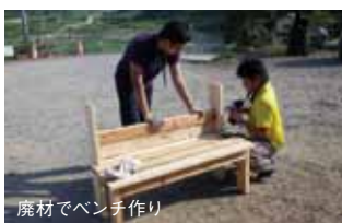
廃材でベンチ作り

7月26日~8月30日の5週間、南三陸支援プロジェクトの現地常駐スタッフとして、宮城県の北部にある南三陸町戸倉地区に滞在させて頂いた。その土地のことは地元の人が1番分かっている、状況は刻一刻と変わる、プロでない学生が現地から出来ることなんて限られてる。そんな事を思いつつも、他所から来た人間が役立てることもあるんじゃないか?という想いで日々お仕事を頂き、参加者一丸となって瓦礫除去、コミュニティカフェ運営、学習支援、イベント運営等の活動をさせて頂いた。